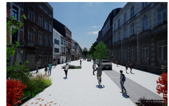
Zone de rencontre de la rue de Bruxelles